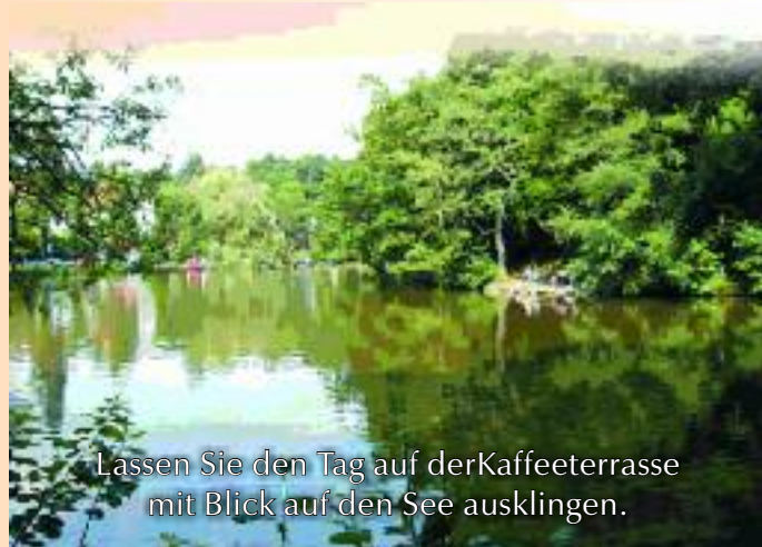
Lassen Sie den Tag auf der Kaffeeterrasse mit Blick auf den See ausklingen.

Auf unserer Internetseite finden Sie weitere Informationen über den Quellenhof, die Umgebung und die Sehenswürdigkeiten der Region.